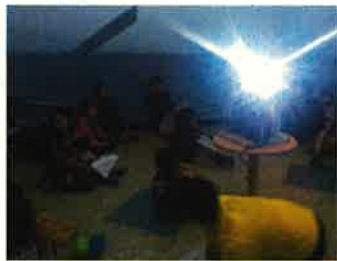
プラネタリウム鑑賞