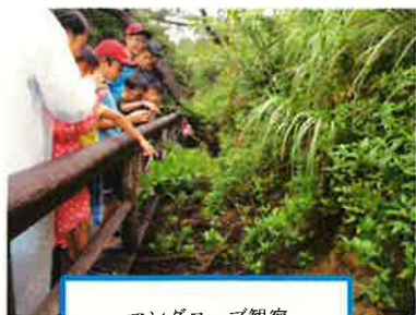
マングローブ観察