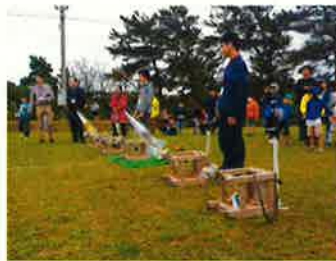
ペットボトルロケット 実射実験