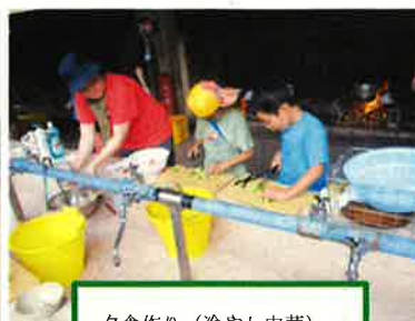
夕食作り（冷やし中華）