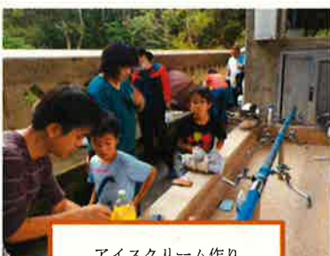
アイスクリーム作り